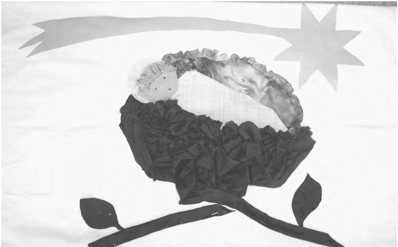
Es ist ein Ros entsprungen