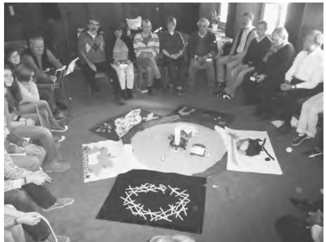
Gottesdienst beim Gemeindefreizeit