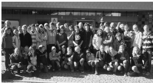
Konfirmandenwochenende in Dachau 23.-25.10.09

Liebe Eltern, ‚frühlings - ahnen‘, ein Same voll blühender Zukunft, voll unendlicher Lebensmöglichkeiten, die tief verborgen in der Erde schlummern und darauf warten, geweckt zu werden. Die Geburt Jesu war für das Volk Israel so ein Ahnen. Ein Same der Hoffnung und des Friedens. Ein Neubeginn. Während unserer Bibelwochen lenkten wir den Blick auf die Naturvorgänge. Er ermöglichte uns das Leben zu erschließen und mit Jesus, der wächst und groß wird, gemeinsam den Weg ins Leben zu gehen. So begannen wir den Kindern von der Kindheit Jesu zu erzählen. Wie er in Nazaret im Haus von Maria und Josef heranwächst und groß wird. Wir begleiteten ihn auf seinem Lebensweg und machten an fol-