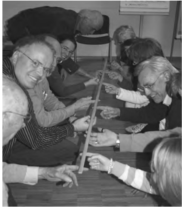
Kooperationsübung in Bernried