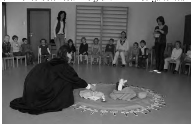
Osterfeier im Kindergarten Krailling 2009