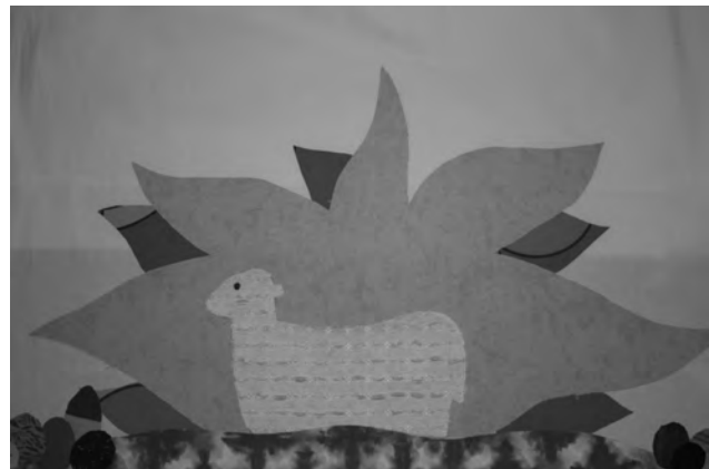
Antependium (Altarbehang) für Ostern