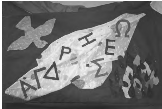
Antependium (Altarbehang) für Pfingsten

12. – 16. 5. 2. Ökumenischer Kirchentag s. S. 2 Die Waldkirche lädt ein zu den Veranstaltungen des OEKT und den Übertragungen in Radio und TV